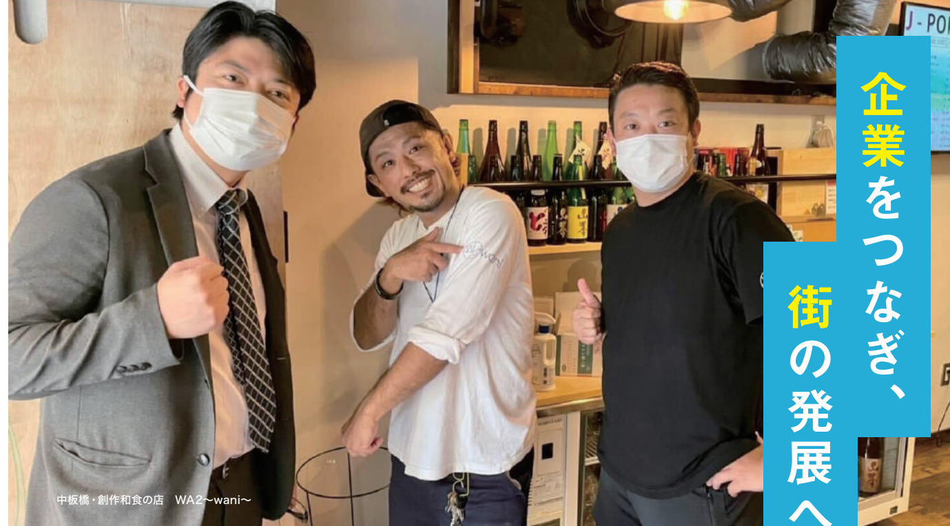
中板橋・創作和食の店 WA2~wani~